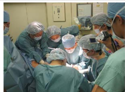
虎の門病院での手術風景 多くの研修生が熱心に見つめている

さらに、海外からも、台湾からは 21 名、韓国からは 3 名、中国からは 4 名、インドネシアからは 8 名の皮膚科医の研修も受け入れ、それぞれの医師は母国における皮膚外科の指導者と