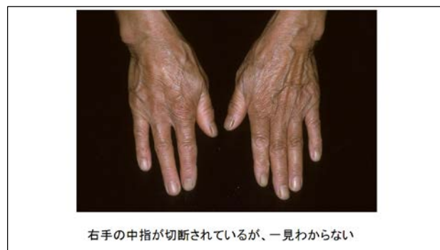
右手の中指が切断されているが、一見わからない

そこで、爪の周りの皮膚と皮下組織をそっくり切除するだけでよいのではないかと考えるようになりました。癌の手術では、癌組織の下層の組織を、十分な深さまで切り取るのが原則です。爪と指の骨との隙間はとても狭いので、十分な深さまで切除するには骨を包む膜組織・骨膜も含めて切除する必要があります。従来の外科手術の常識では、骨膜が剥がされた、むき出しの骨には遊離植皮は生着しないことになっていますが、私の過去の経験では指に関しては遊離植皮が生着することが分かっていました。そこで、爪とその周りの組織を骨膜とともに切除して、遊離植皮で修復する手術の方式を定型化することができました。これにより、指の温存が可能となり、患者さんたちは切断をまぬがれるようになりました。この術式については折に触れて学会で講演し、今でも国内だけでなく海外でも普及に努めているところです。