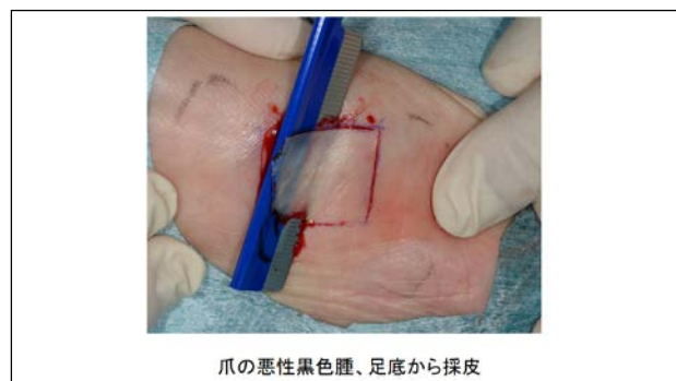
爪の悪性黒色腫、足底から採皮