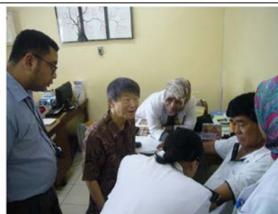
インドネシアでの術前診察風景