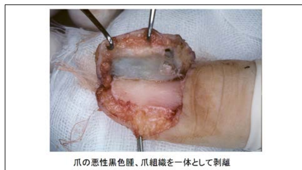
爪の悪性黒色腫、爪組織を一体として剥離