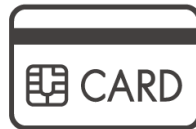
VISA MasterCard AMEX